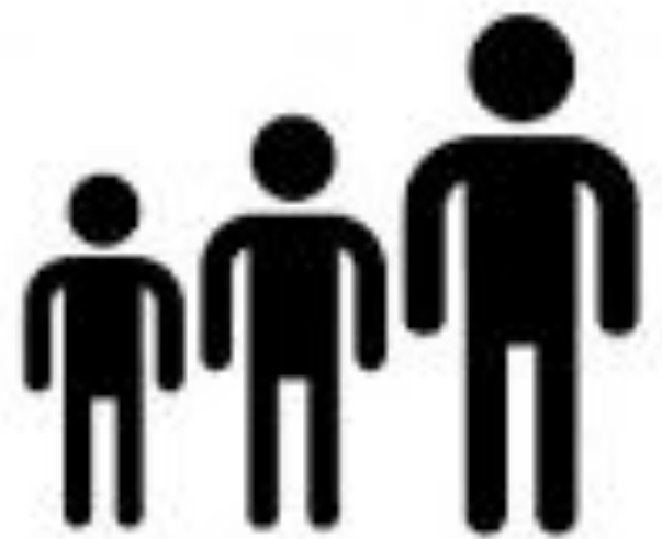
ACTO DEL HOMBRE